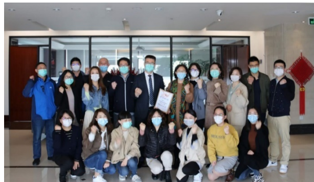
图 3.1 西子智能停车员工代表向疫情前线捐赠

公司根据企业发展目标，结合政府、社会和其他相关方对公司的期望，确定支持行业发展、教育作为公司的重点公益支持领域。公司通过疫情防控公益、协办行业（技术交流）会议、国家标准工作会、无偿献血、“领导结对”、“五水共治”、“助力八大行动——植树活动”等，实现公益责任。